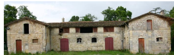
La vacherie et l'écurie construites en 1905 : au centre la vacherie, dans l'aile gauche l'écurie et dans l'aile droite un chai de rangements d'outils

de 620 m 2 sur deux niveaux, en moellons et couvert de tuiles creuses, est achevé en septembre 1905.