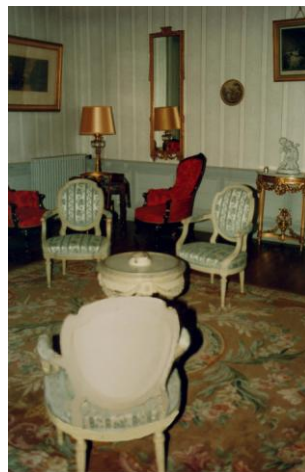
L'escalier et un des salons du château